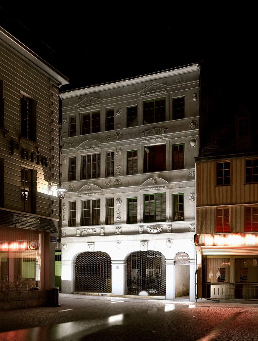
N°28-30, rue du Bac. Place du Gaillarbois vers minuit