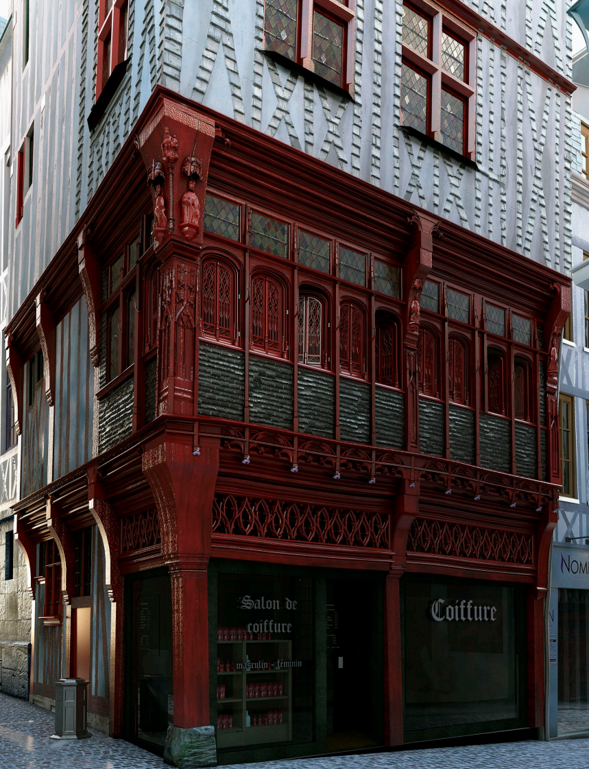
66, rue du Bac. Vue depuis la rue, vers 14h30.