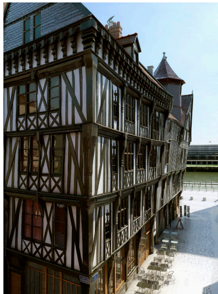
Le logis des Caradas, depuis la rue de la Savonnerie

aidé de Benjamin Girard et Balthazar Auxietre